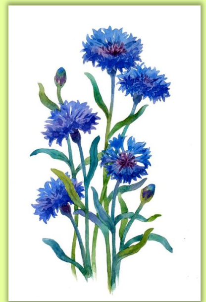
Примеры картинок для детей 4-5 лет - клевер, ромашка, василек.