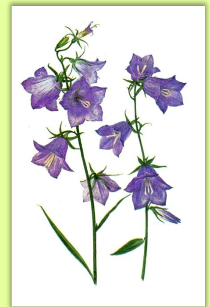
Примеры картинок для детей 5-7 лет: василек, цикорий, колокольчик