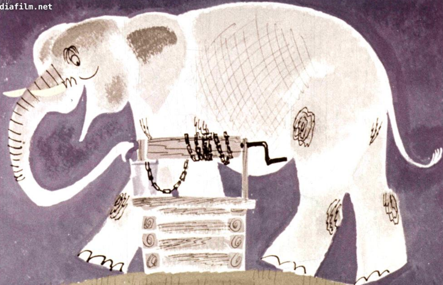
Слон – Длинный Хобот.