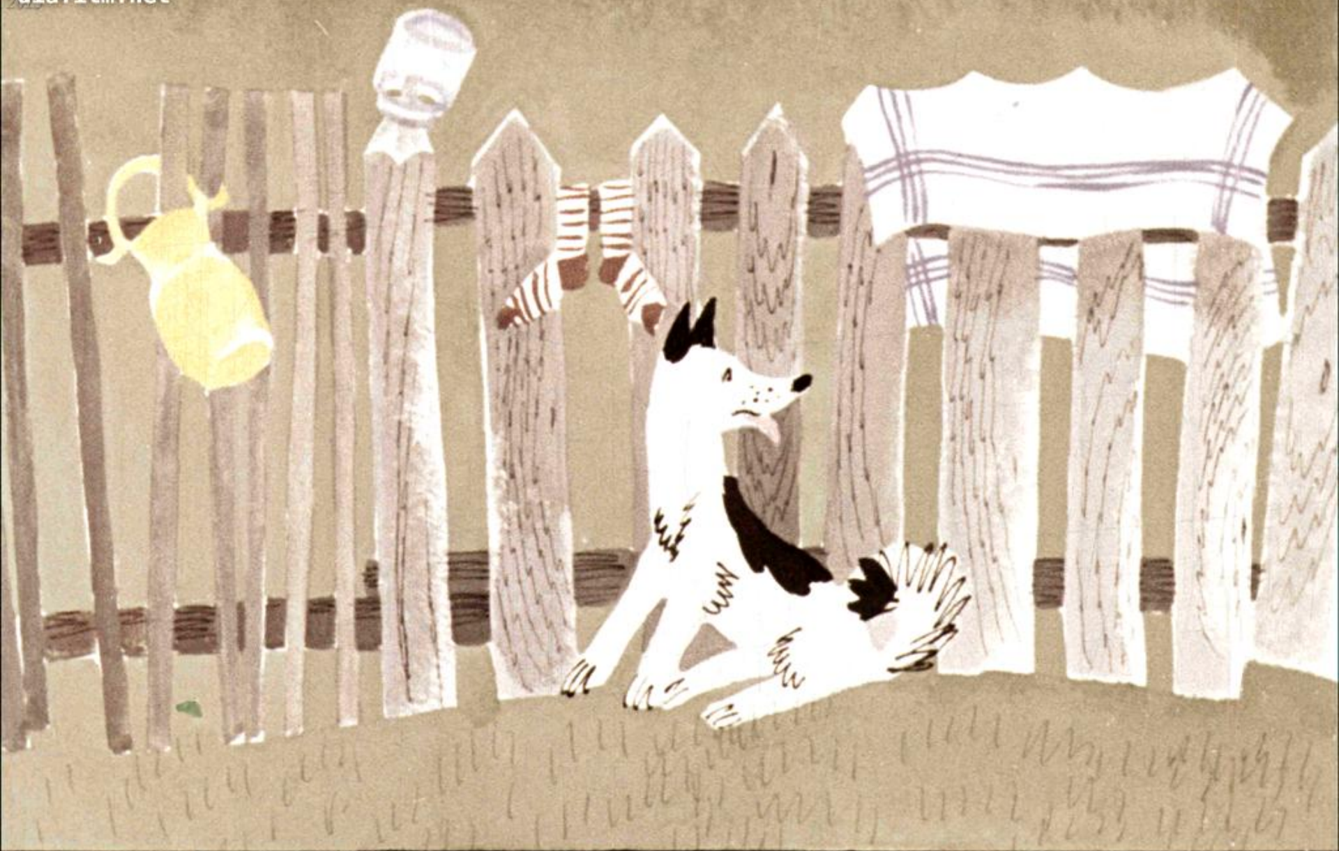
Собана – Норотний Хвост.