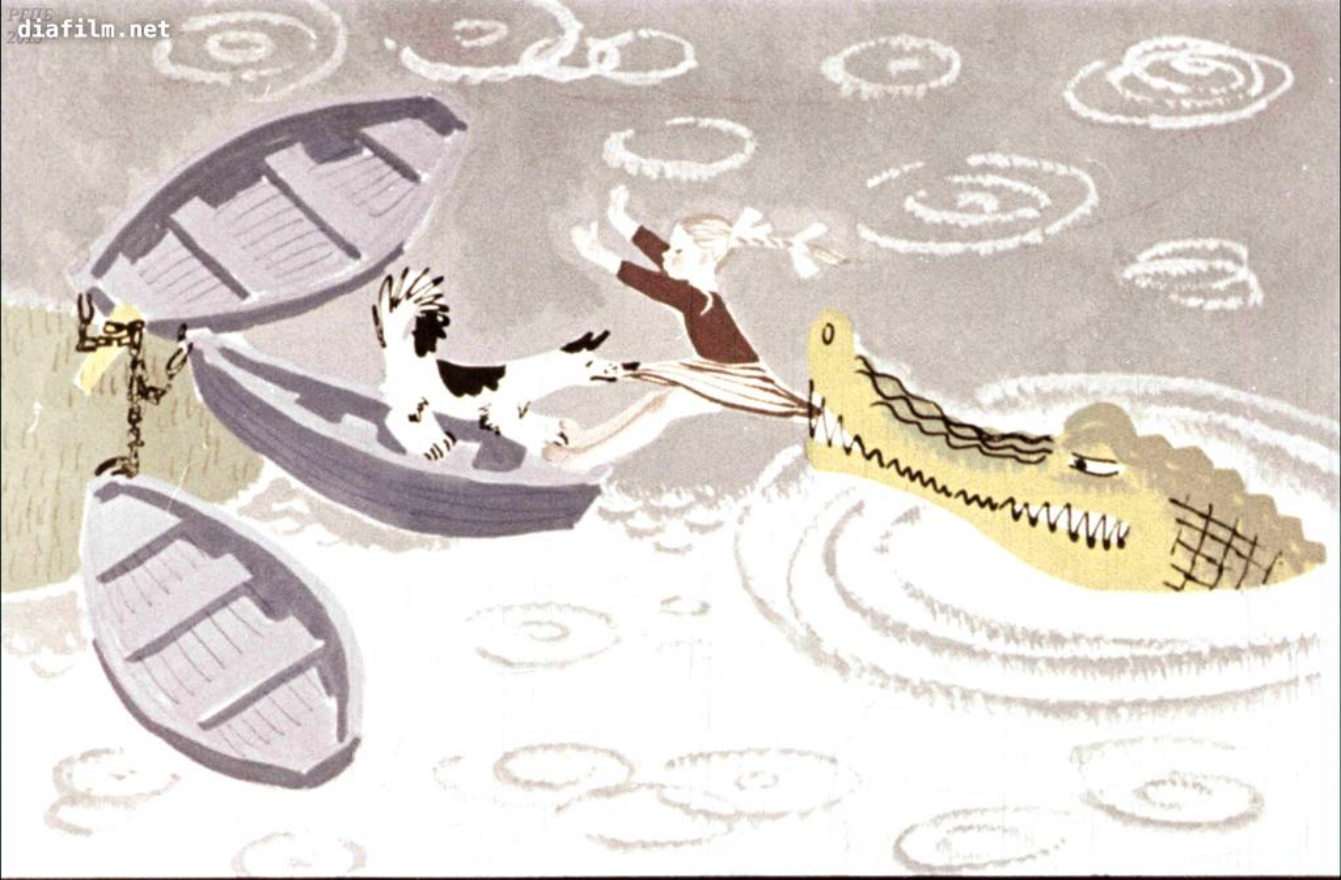
Она ухватилась за юбку Девочки.