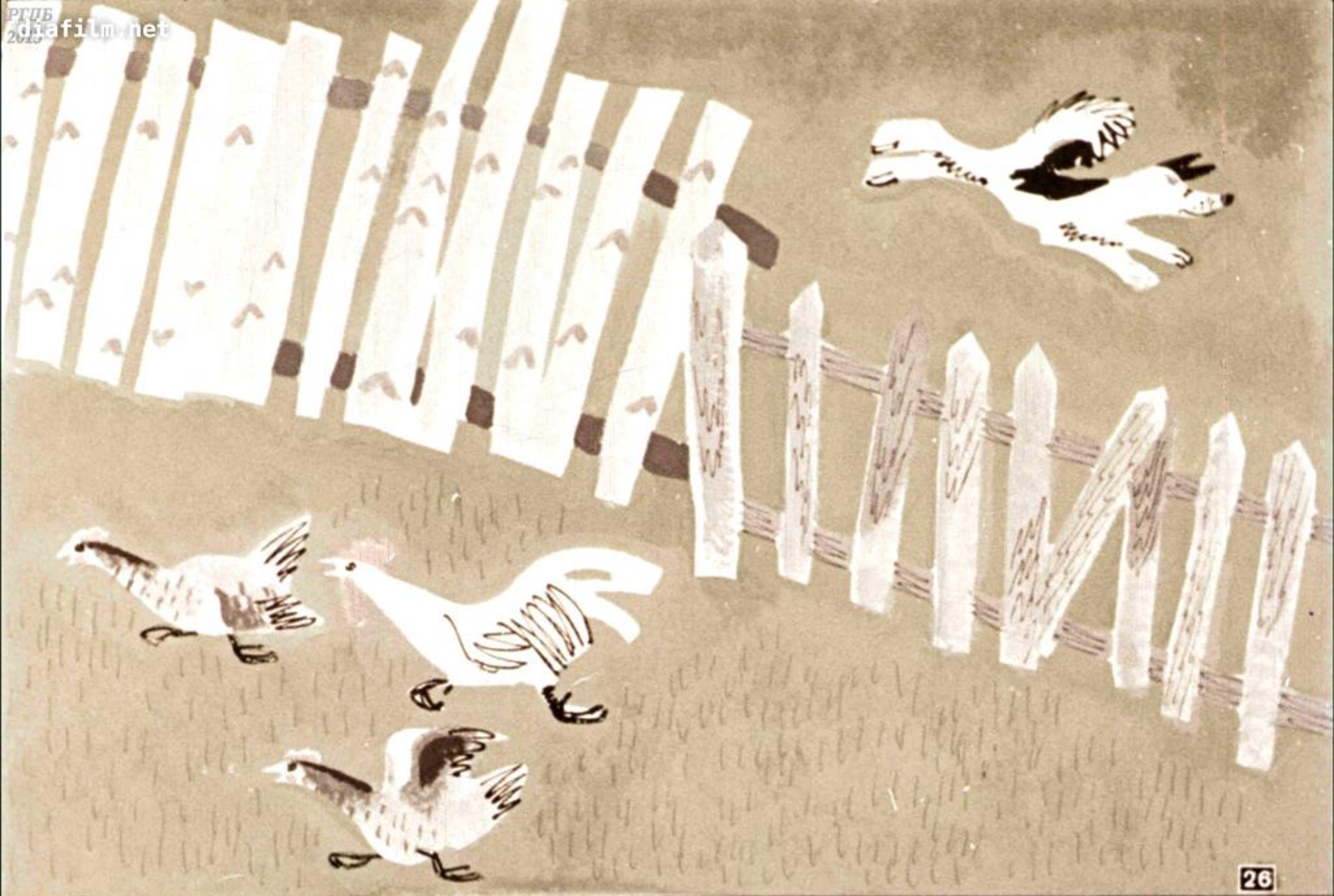
А Собака Норотный Хвост бросилась на помощь Девочке.