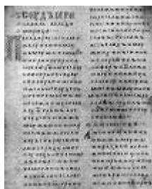
Двинская уставная грамота

Взятка – срыв, поборы, приношения, дары, гостинцы, приносы, пикшеш, бакшиш, хабара, могарычи, плата или подарок должностному лицу, во избежание стеснений, или подкуп его на незаконное дело. Лихоимец – жадный вымогатель, взяточник».