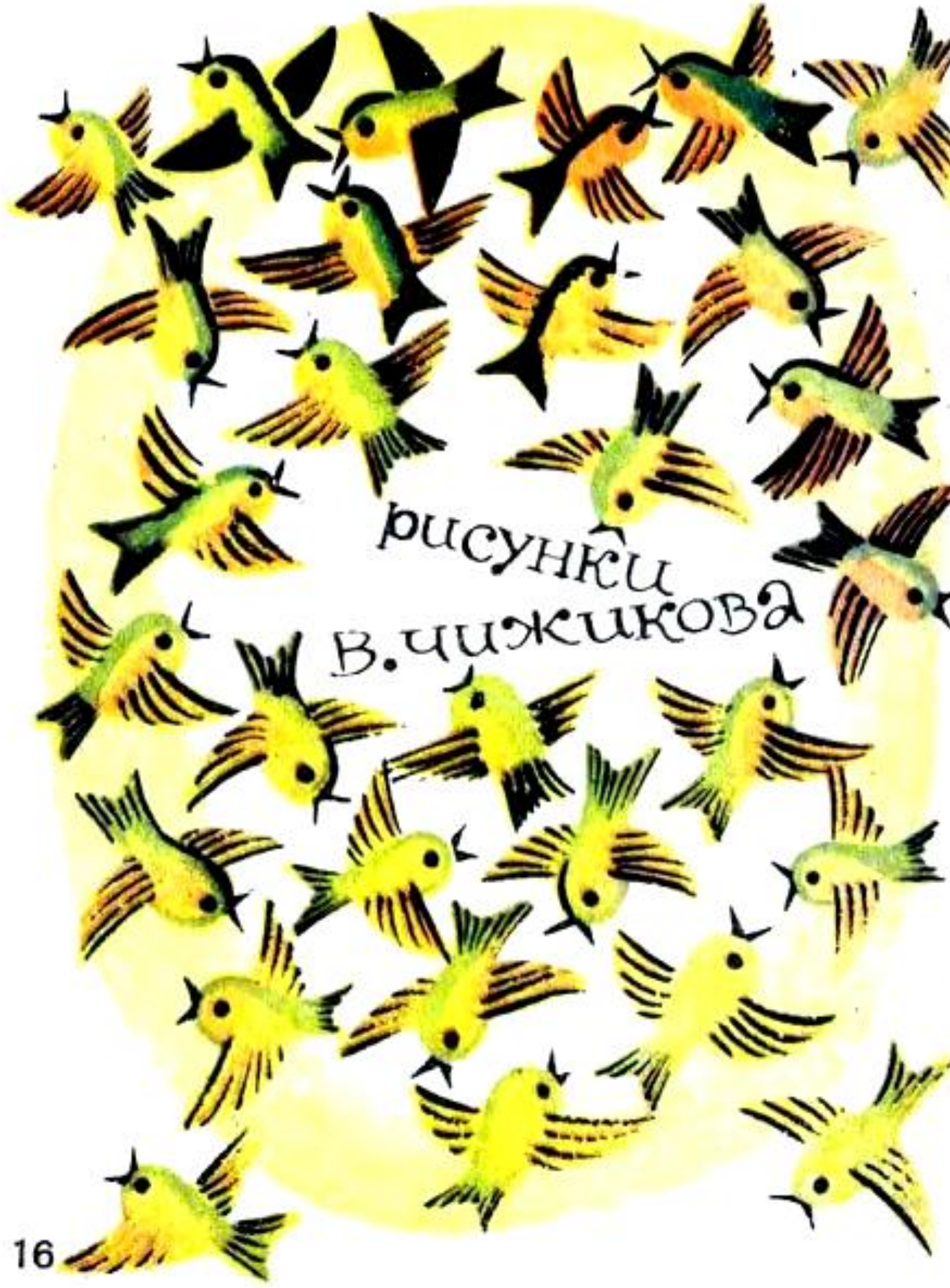
рисунок В. Чижикова