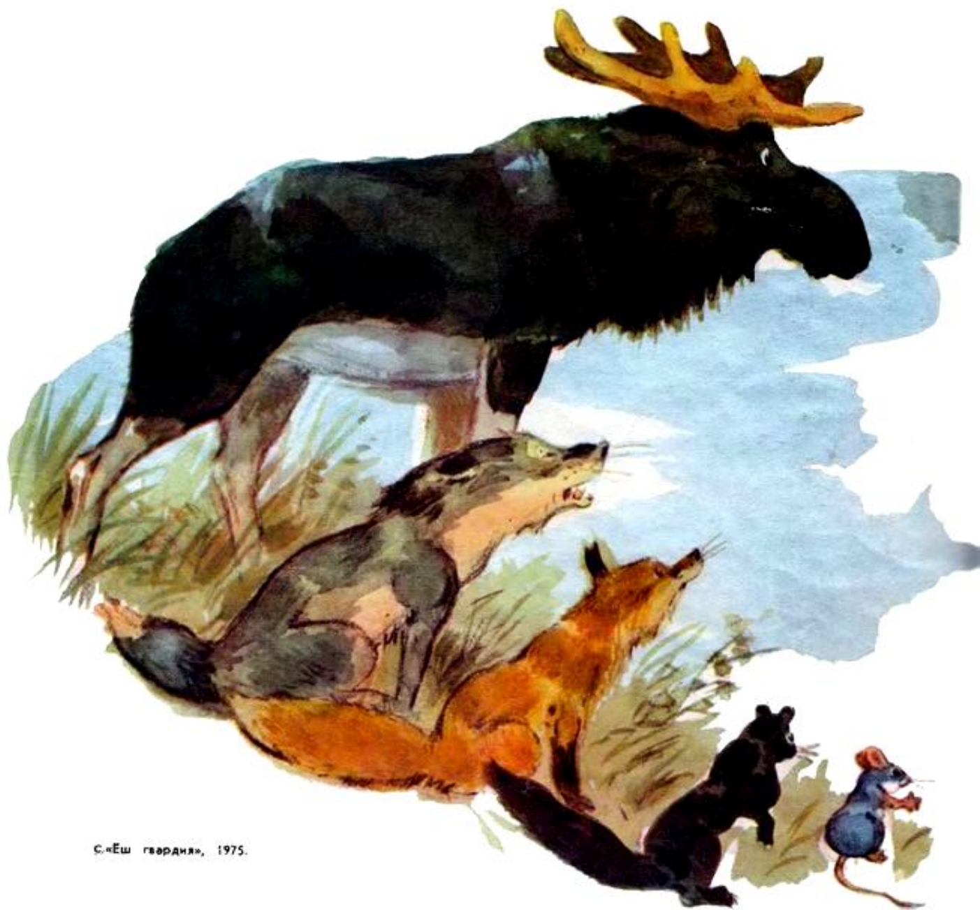
С. «Еш гврдия», 1975.