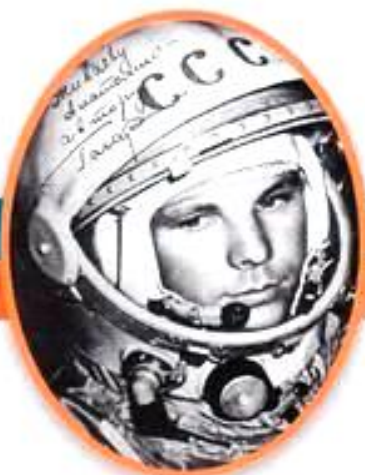
Юрий Алексеевич Гагарин Первый космонавт