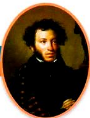
Александр Сергеевич Пушкин Великий русский поэт