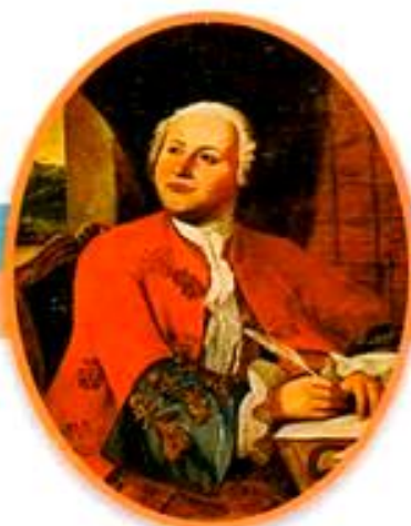
Михаил Васильевич Ломоносов Великий русский ученый

Ты, конечно же, вспомнишь, что Александр Сергеевич Пушкин написал много прекрасных стихов и чудесные сказки: «Сказка о царе Салтане», «Сказка о рыбаке и рыбке», «Сказка о мертвой царевне и о семи богатырях», «Сказка о золотом петушке». Петр Ильич Чайковский писал необыкновенно красивую музыку, создал цикл пьес «Времена года» и хорошо знакомый тебе «Детский альбом». Михаил Васильевич Ломоносов — великий русский ученый, он многого добился в самых разных областях знаний: литературе и искусстве, физике и астрономии, географии и истории. Им сделано много важных научных открытий. Юрий Алексеевич Гагарин был первым космонавтом, первым человеком, облетевшим на космическом корабле «Восток-1» нашу планету.