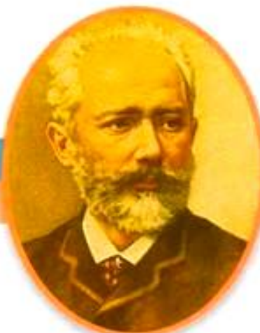
Петр Ильич Чайковский Великий русский композитор