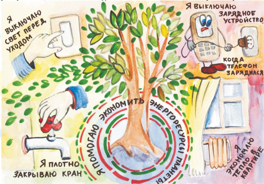
Шманова Оксана, 6 класс, Гимназия №5 г.Чебоксары