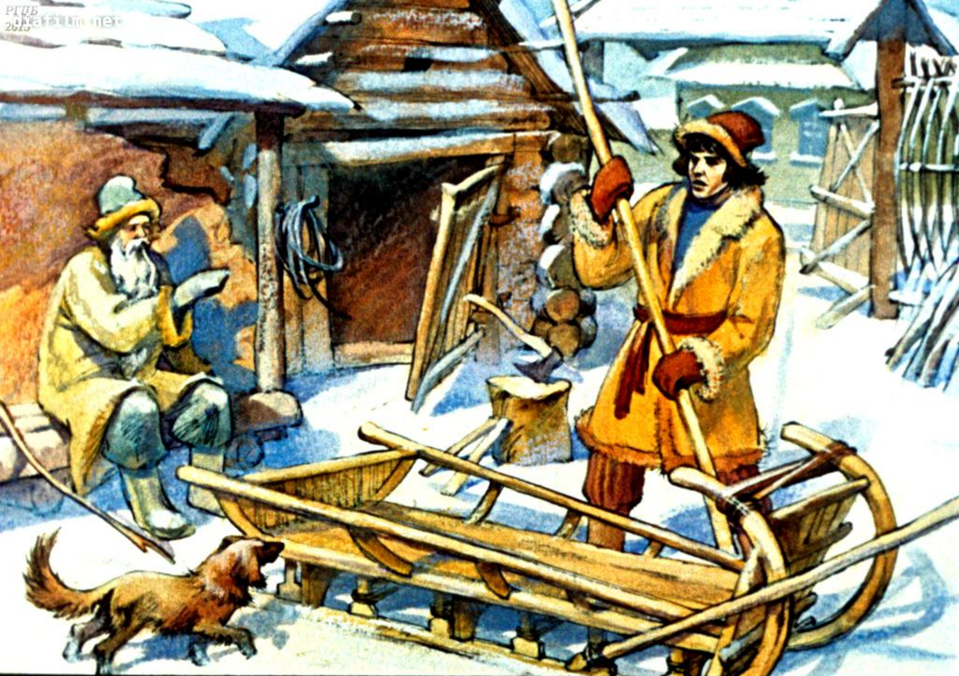
старику сани справил.