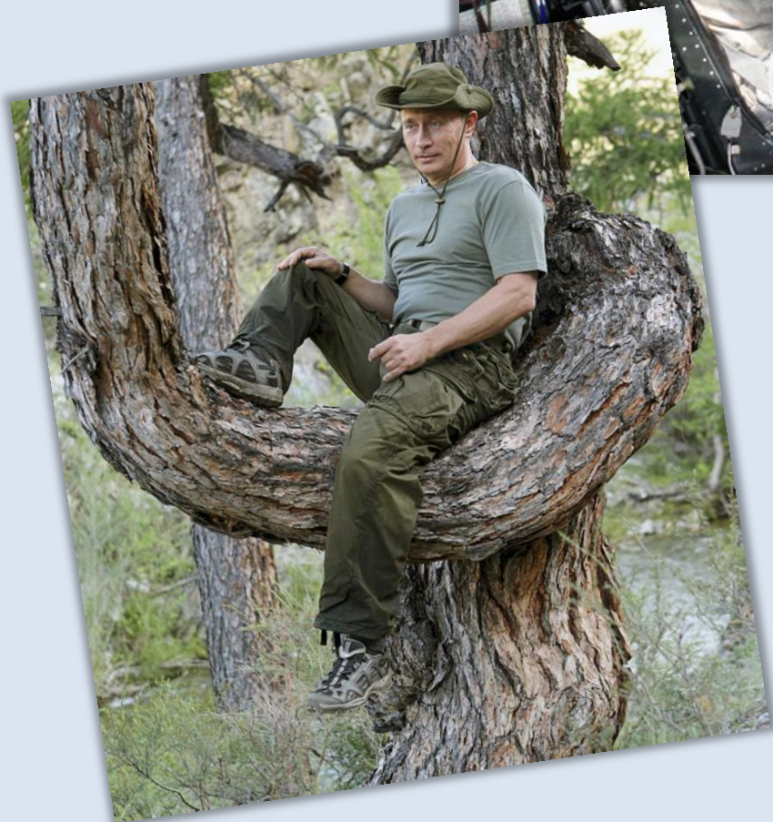
Республика Тыва, 2009 г.