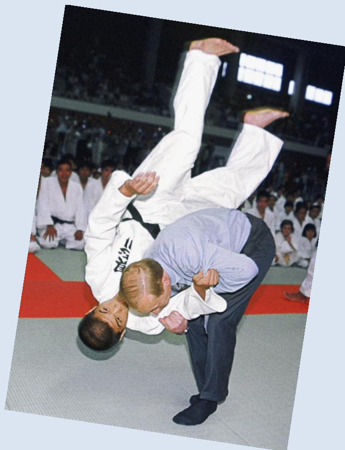
Гусикава (Япония), 2000 г.