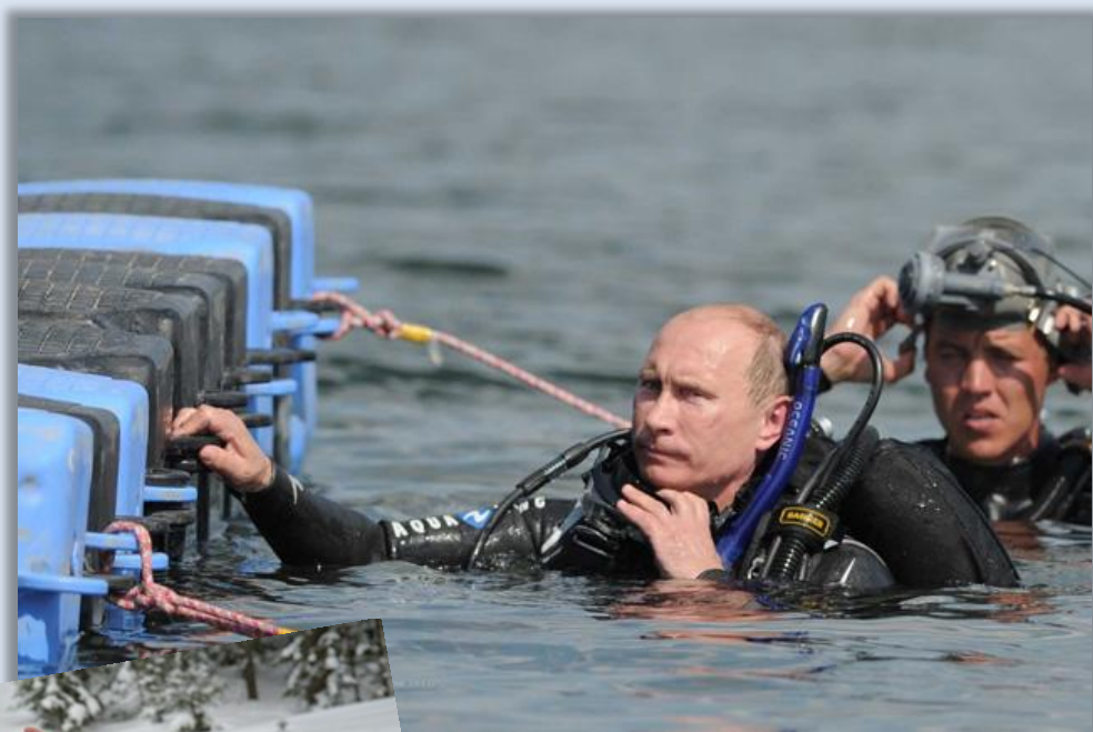
Тамань, 2011 г.