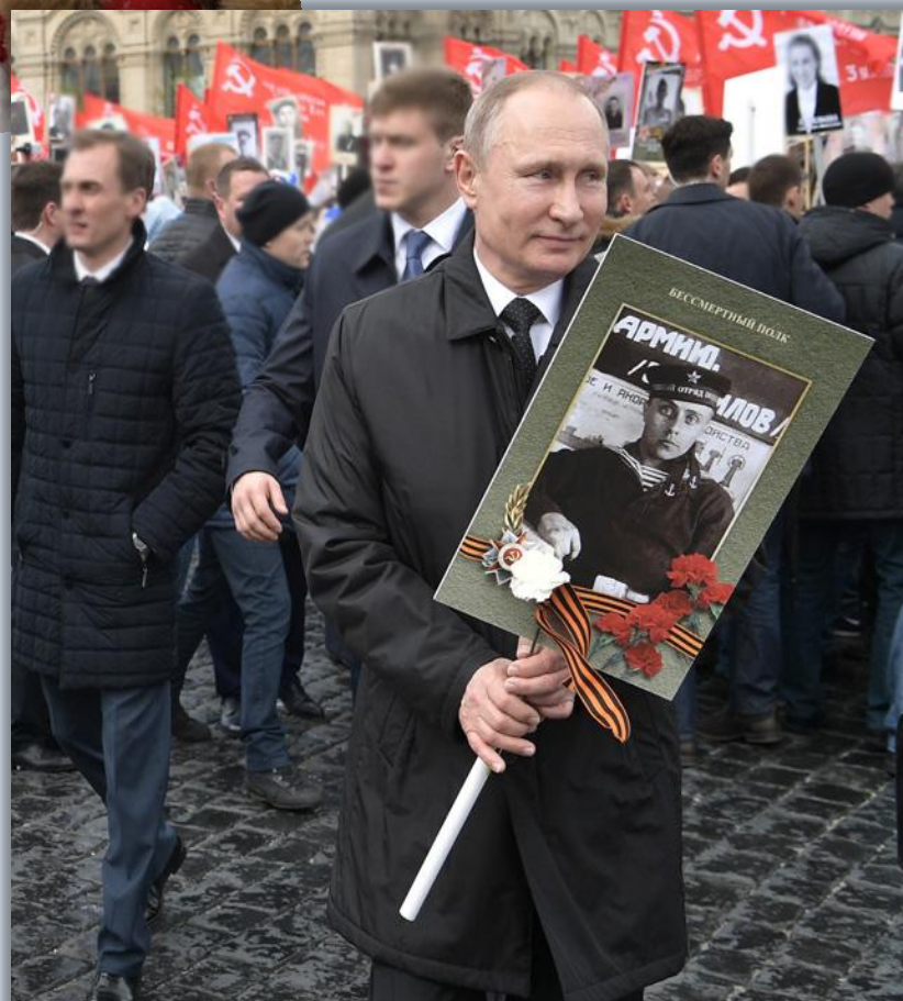
Москва, 9 мая 2017 г.