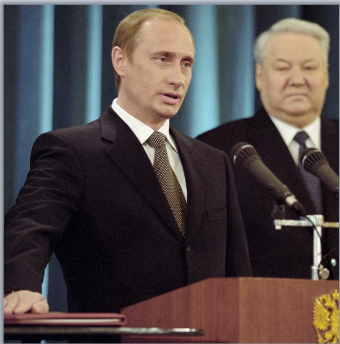
Первая присяга Президента РФ, 2000 г.

А мы тем временем решили напомнить читателю о некоторых ярких и необычных моментах из биографии юбиляра.