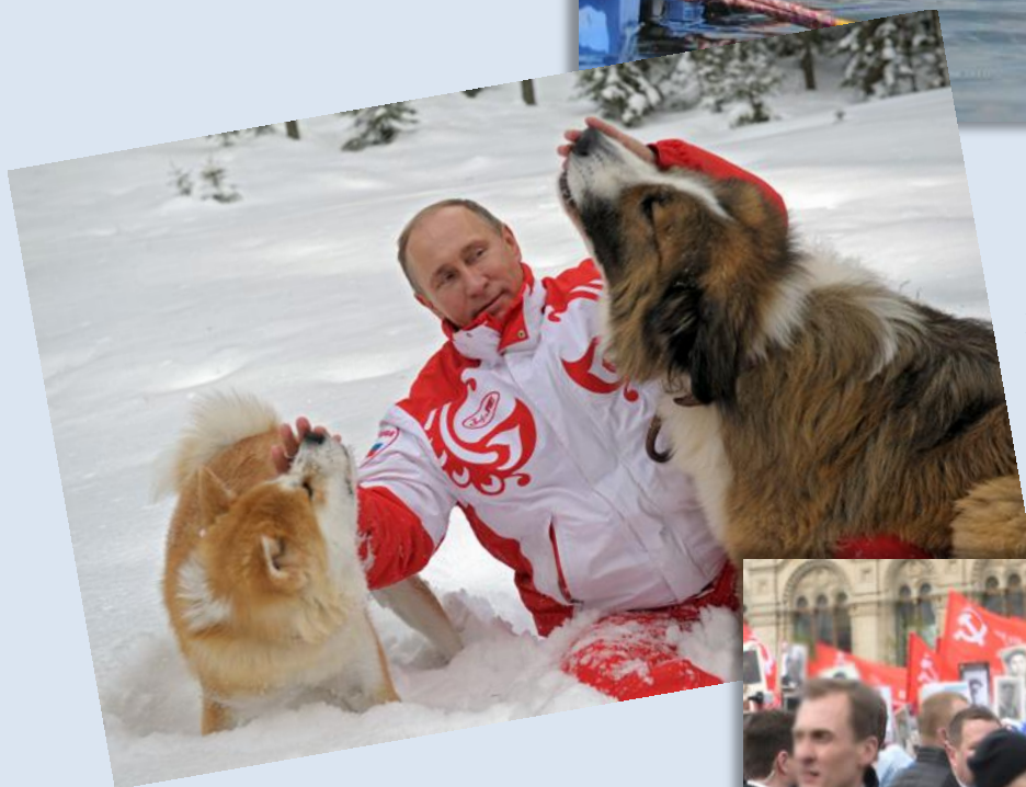
Подмосковье, 2013 г.