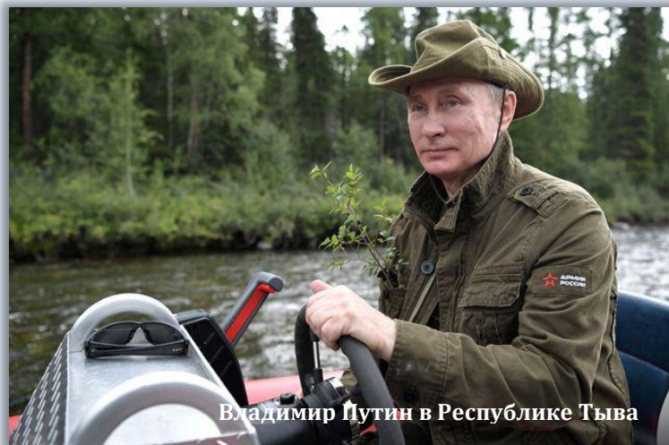
Владимир Путин в Республике Тыва