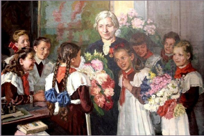
Картина А. Харьковского "Награда Учителю"

5 октября более чем в ста странах отмечают Всемирный день учителя. В этот день принято поздравлять всех, кто трудится в сфере образования. Для России это особый праздник, ведь наших педагогов знают во всем мире! Вспоминаем самых известных русских учителей.