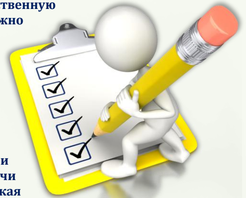
Схема самоанализа НОД

Методисты и педагоги используют разные схемы анализа НОД. Какую из них выбрать? Рассмотрим схему, которая поможет воспитателям сделать выводы в условиях ограниченного времени.