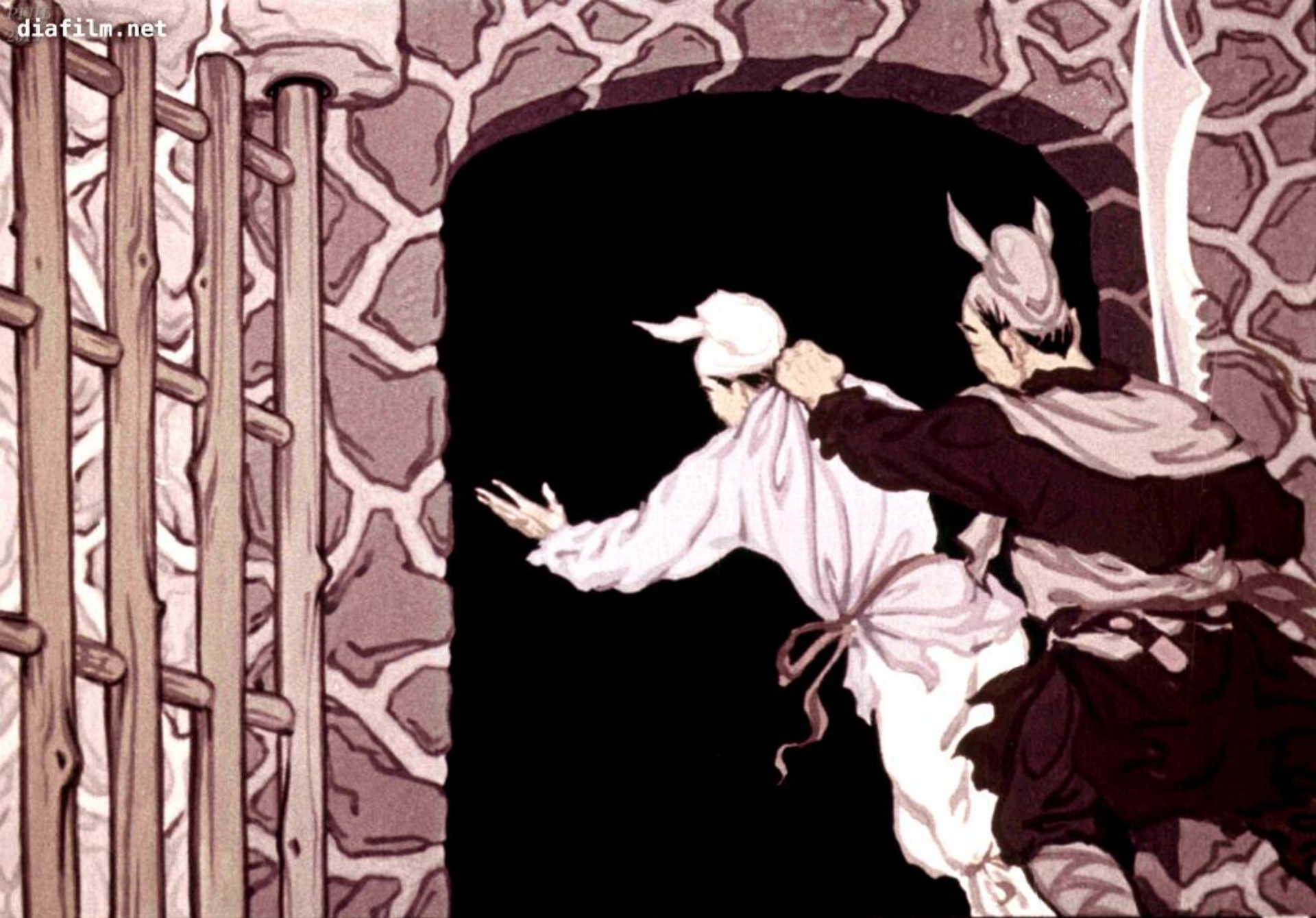
Он кликнул стражника, и Ван Ли бросили в тюрьму. 9