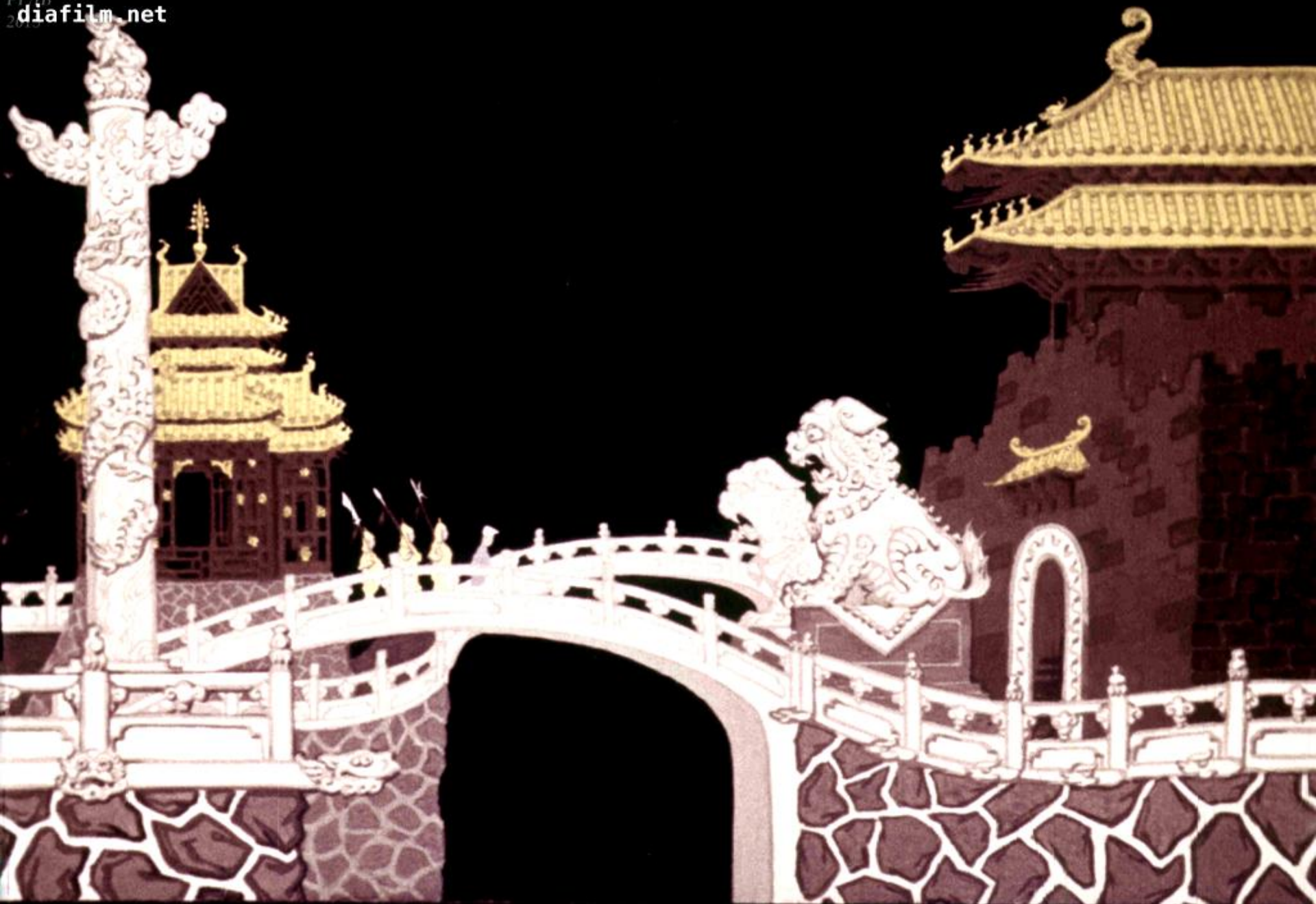
... и Ван Ли повели в императорский дворец.