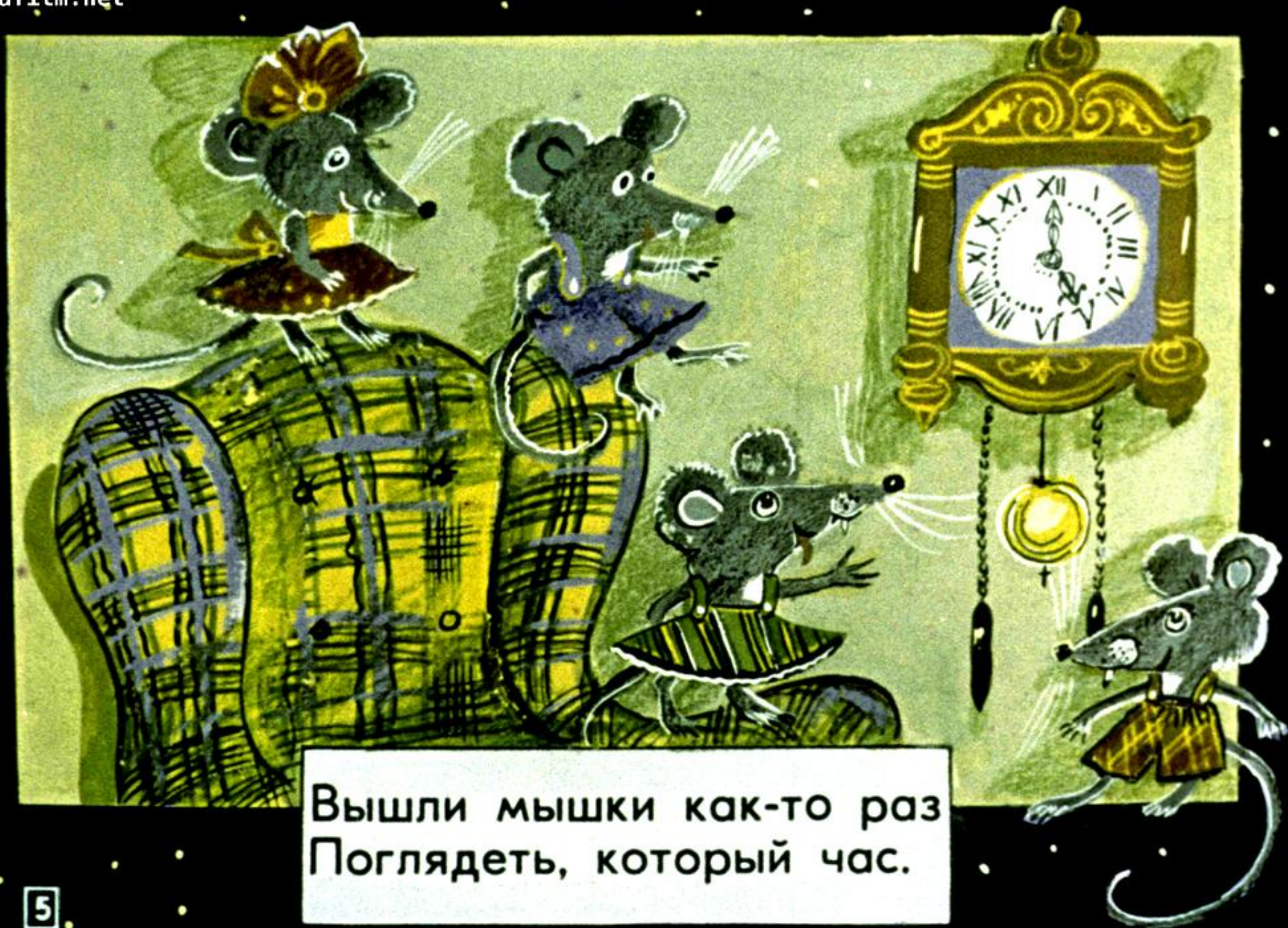
Вышли мышки как-то раз Поглядеть, который час.