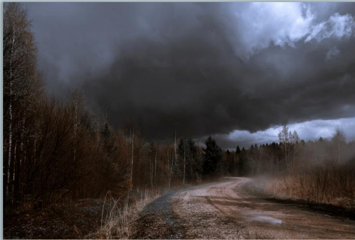
Небо в ноябре