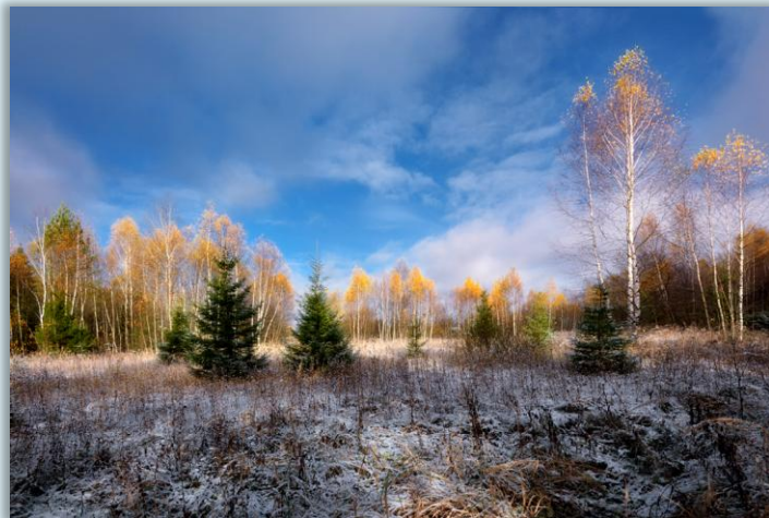
Деревья в ноябре

Однолетние растения отмирают, сбрасывая семена в землю. Будущей весной, в прогретой земле, семена, пролежавшие всю зиму под снегом, вновь дадут растению жизнь. Многолетние растения все лето запасают питательные вещества в корневищах. Желтеет и тускнеет их яркая летняя зелень. Некоторые травы сохраняют цвет, даже плоды (брусника и клюква).