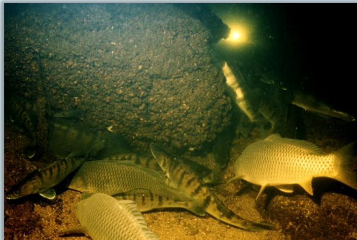
Рыба в зимовальных ямах

Человек тоже объект живой природы, поэтому готовятся и ждут наступления зимы люди, стараются наблюдать и учиться у природы. Приобретают и надевают подходящую одежду. Дома и окна утепляют различными способами. Запасы еды и дров заготавливают. Приметы зимы друг другу в поговорках передают: «Год кончается, а зима начинается», «Шубка зимой не шутка», «В ноябре зима с осенью борется».