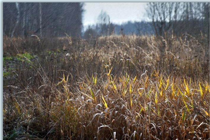
Многолетние растения поздней осенью

Однолетние растения отмирают, сбрасывая семена в землю. Будущей весной, в прогретой земле, семена, пролежавшие всю зиму под снегом, вновь дадут растению жизнь. Многолетние растения все лето запасают питательные вещества в корневищах. Желтеет и тускнеет их яркая летняя зелень. Некоторые травы сохраняют цвет, даже плоды (брусника и клюква).