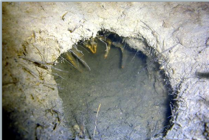
Так зимуют раки

Температура воды в реках и водоемах с каждым днем понижается, намерзает лед – понятно подводным жителям: наступает по времени года зима. Но водные обитатели ее уже ждут. Раки роют норы в берегах рек и ведут малоактивный образ существования. Все лето рыбы накапливали жир, чтобы зимой его экономно расходовать. Такие виды рыб, как карп, линь, сом и карась, отправляются в это время в зимовальные ямы, где бок о бок греются, находясь в полусонном состоянии. Активные хищники - щука и окунь, образа жизни не меняют и в зимнее время.