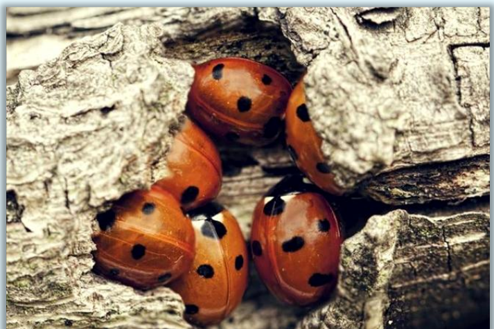
Божьи коровки приготовились к зимовке