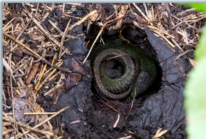
Ящерица впадет в спячку