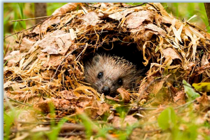
Ежик готовится к спячке

Зная о наступлении зимы, многие животные впадают в зимнюю спячку. Медведи устраивают себе теплые и уютные берлоги. В спячку впадают и другие животные: барсуки и ежи, еноты и бурундуки, хомяки и сони, летучие мыши и змеи, лягушки и ящерицы.