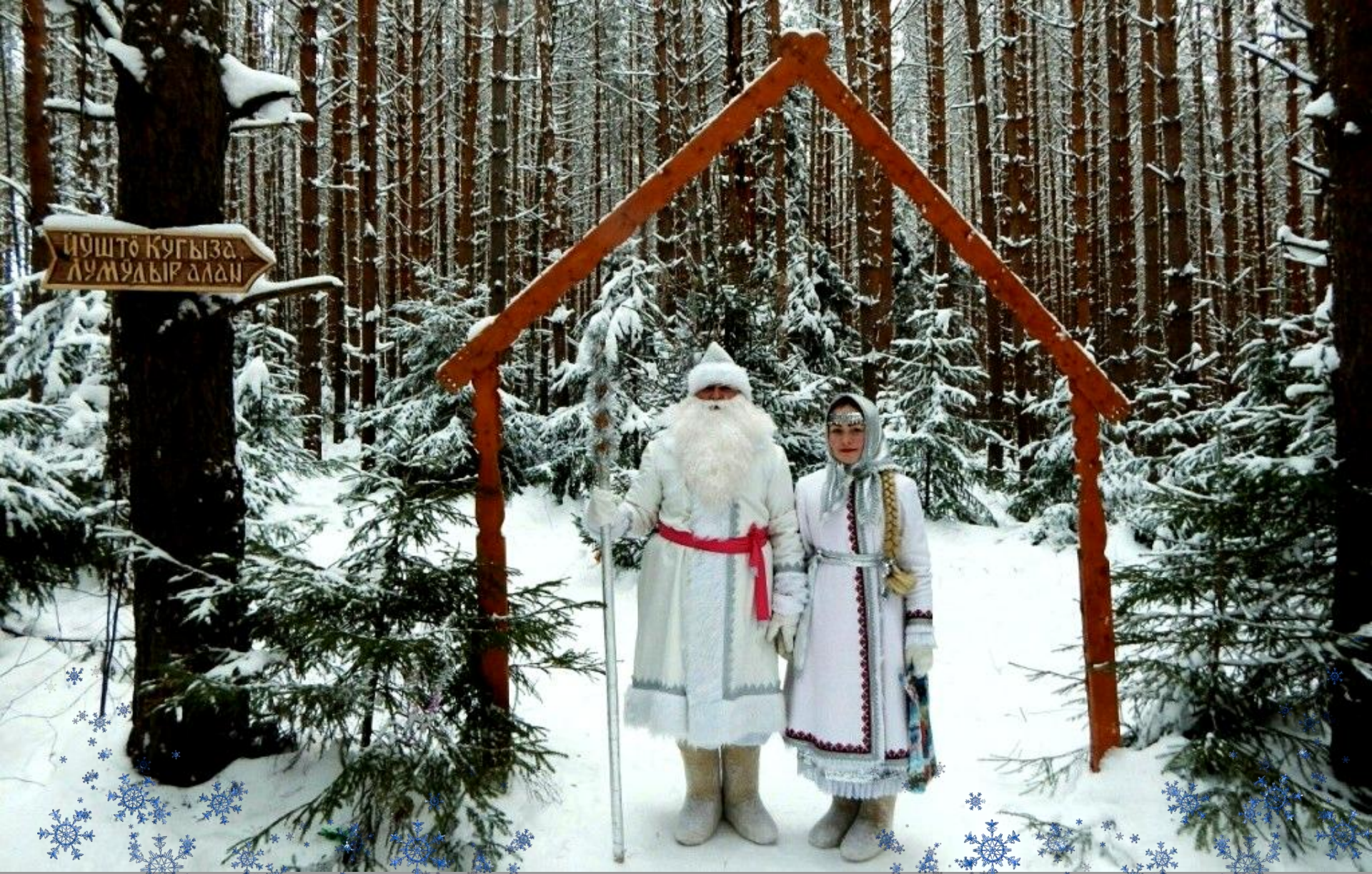
Марийский Дед Мороз Йюшто Кугыза - один из самых древних зимних волшебников России. Его имя переводится как «Холодный Старик». У него есть спутница - внучка Лумудыр («Снежная девочка»), а передвигается марийский Дед Мороз на лыжах.