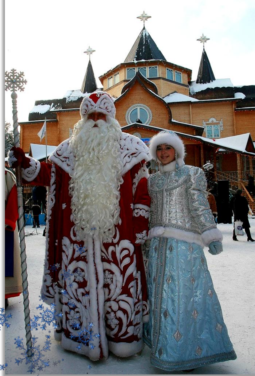
Дед Мороз вместе с внучкой Снегурочкой живет в городе Великий Устюг в прекрасном деревянном дворце.