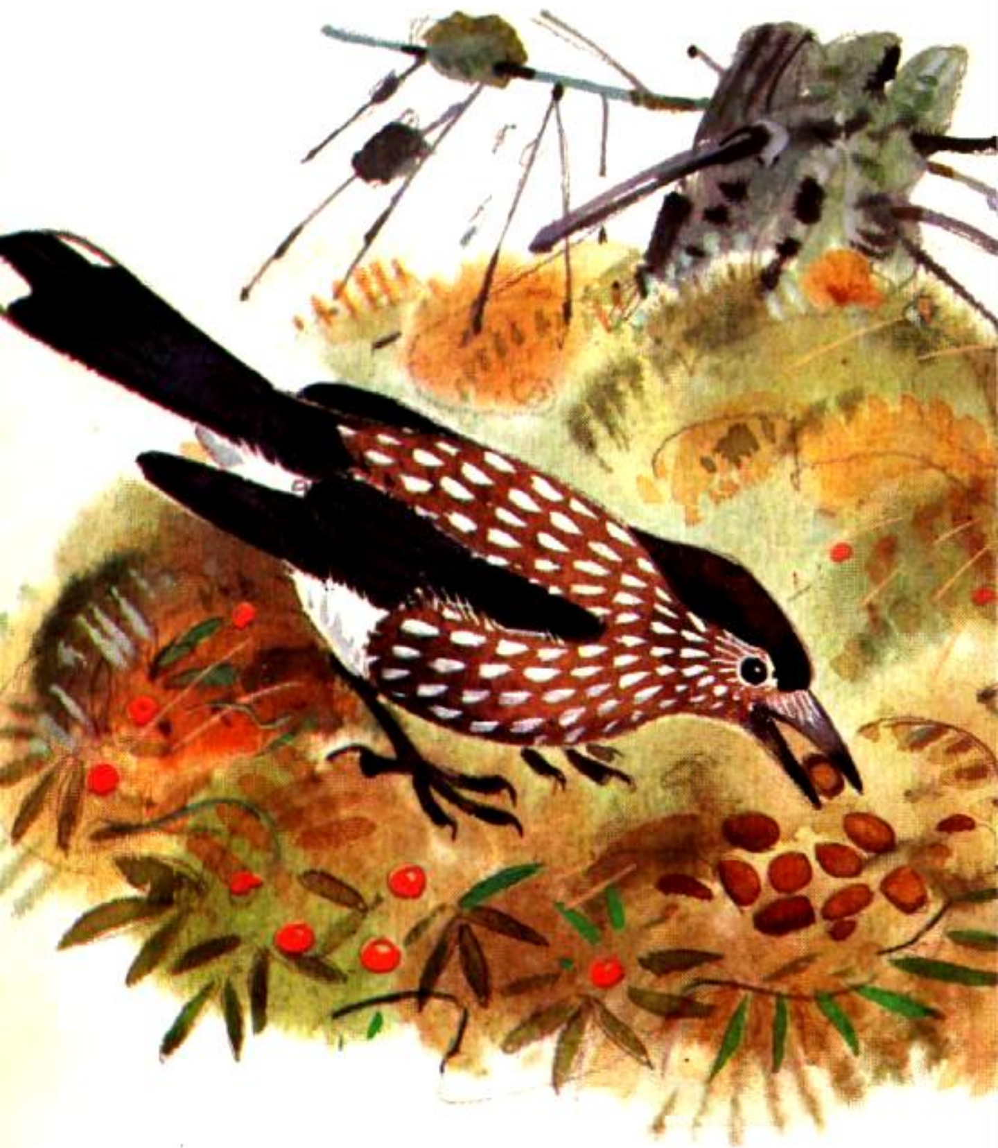
Кедровка орешки кедровые в мох попря-