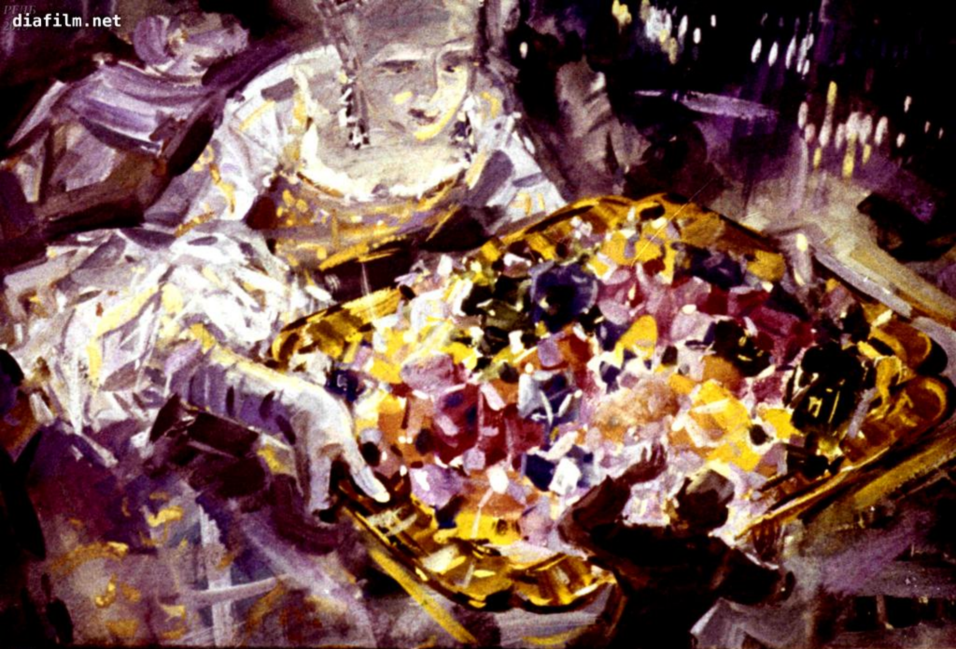
Подходит эта девица к Илюхе и с поклоном подаёт ему поднос.—«Прими-ко, молодец!»