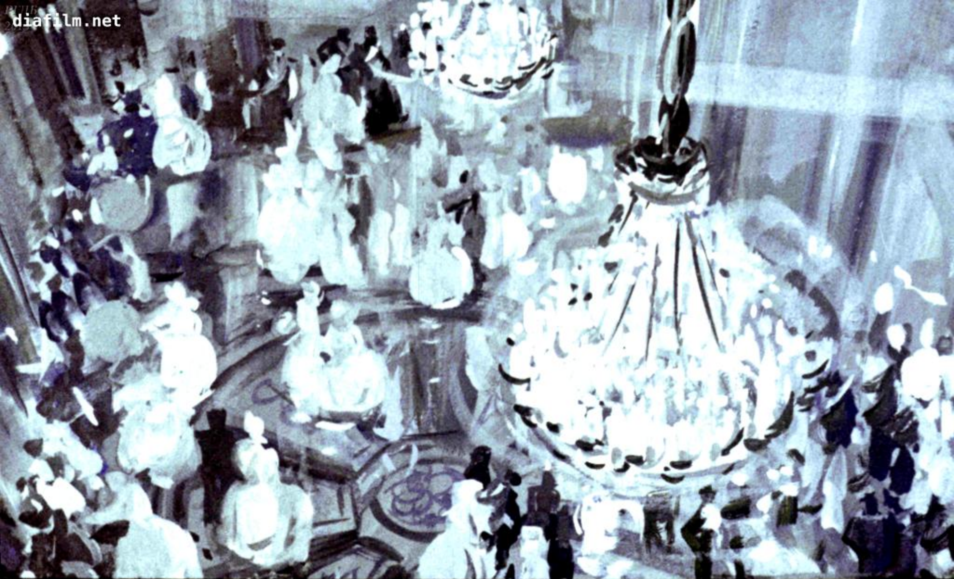
Народу в том помещенье полно. По-господски одеты, и все в золоте да заслугах. У кого спереду навешано, у кого сзади нашито, а у кого и со всех сторон. Видать, самое высшее начальство.