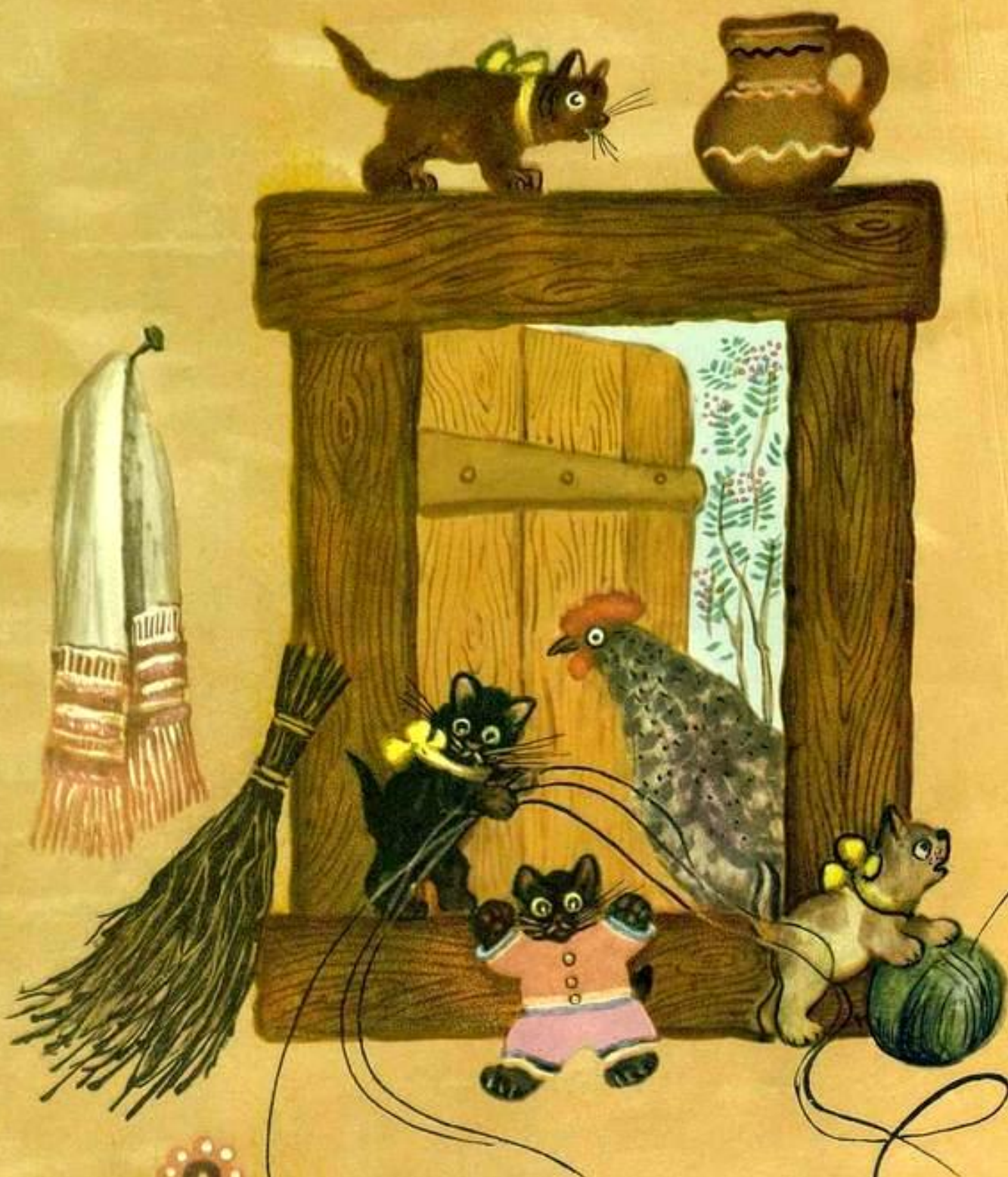
Кошка в окошке