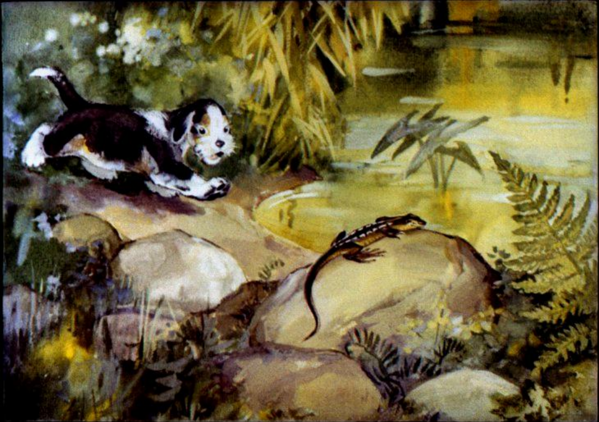
Тихонько подкрался щенок к ящерке.