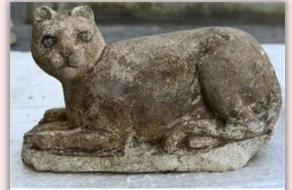
Статуя кота, сделанная в Древнем Риме еще до н.э.

Одновременно с манией преследования в католической Европе существовала вера в волшебных котов - матаготов, приносящих счастье и процветание дому. Вспомните кота в сапогах - это типичный матагот, пришедший в сказку Шарля Перро из фольклора. Кошки - излюбленный литературный персонаж и в англоязычной литературе, о них писали Р. Киплинг, Марк Твен, Эдгар По.